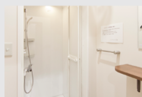
シャワー、お着替え