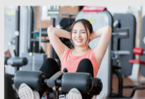
本格マシンで トレーニング