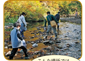
こんな場所では、長靴が活躍します

服装 長そで、長ズボン、運動靴、帽子、長靴（沢歩き用）など。 ハイキングや軽い山歩きができる程度の装備で。